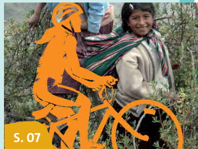
S. 07 Bike & Help-Tour zum DEKT in Nürnberg 2023