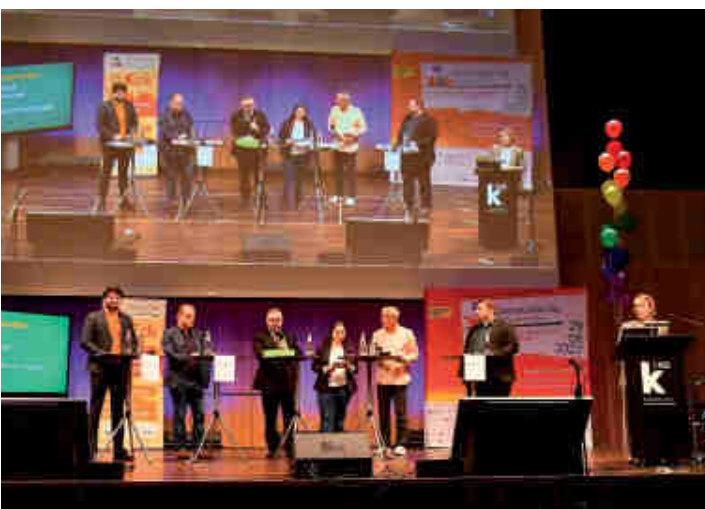
Impressionen vom „Heißen Eck“, Die große Bühne