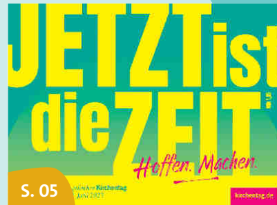
38. DEKT in Nürnberg 2023