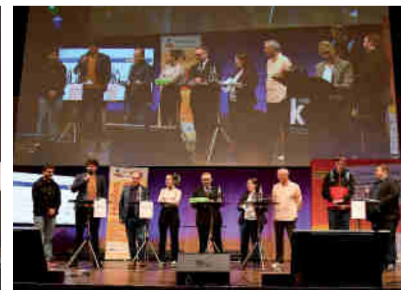
Die Abgeordneten mit ihren Tandempartner*innen.