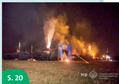
S. 20 VCP-Bundeslager